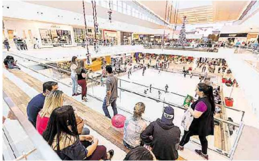
Local tem 136 m² de área construída e quase todas as 250 lojas ocupadas

EMPREENDIMENTO RECÉM-INAUGURADO registrou filas e estacionamento lotado